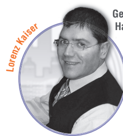
Geschäftsführer Hausverwaltung Hecker:

Die DOMUS Software AG stellte sich als idealer Sparringspartner heraus, um den Change-Prozess in der Hausverwaltung Hecker, Nachf. Kaiser, zu begleiten.